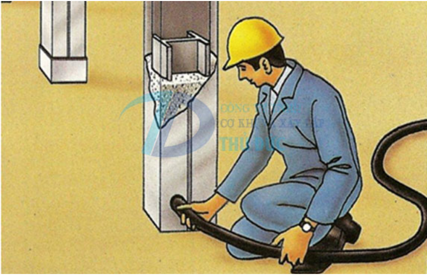
Bê tông nhẹ đổ sàn cách nhiệt, chống nóng: